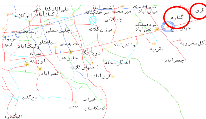
نقشه ۱. موقعیت دو روستای دولت‌آباد (گناره) و فرق.

هرچند آن مقدار از این اسناد که به دست ما رسیده در مقایسه با آنچه در اصل بوده اندک‌شمار است، همچنان اسناد بسیاری از این قبیل در مراکز اسناد و موزه‌ها، و به‌ویژه